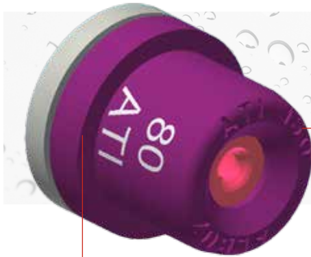
Tipo de boquillas